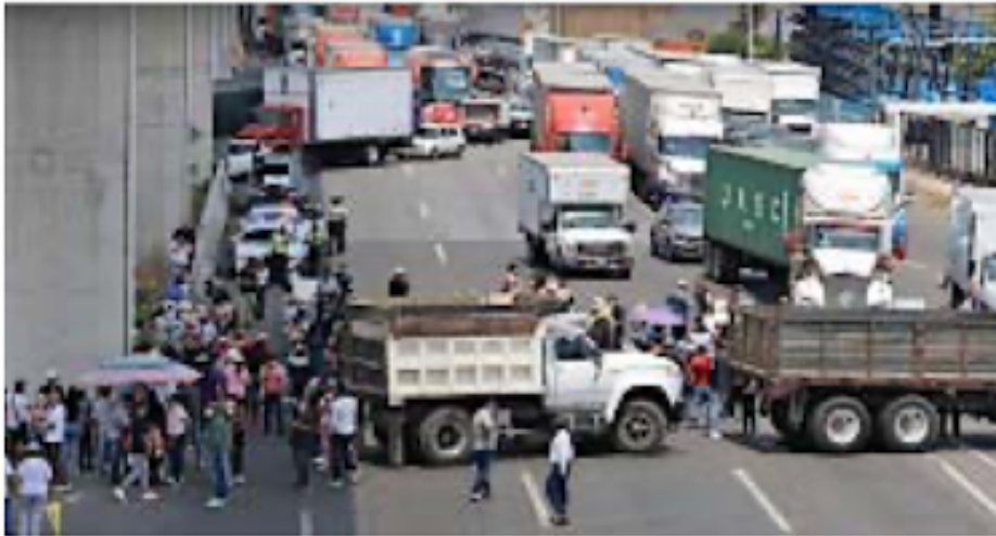
Korín de la Cruz