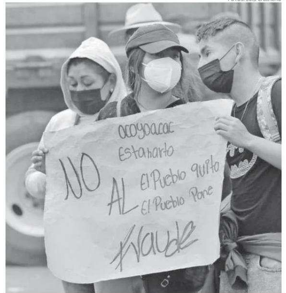
Al rededor de las 16:00 horas los manifestante liberaron la vía

Pedro Cholula se intentaron desviar las boletas para que no fueran resguardadas, por lo que piden que las autoridades electorales tomen las denuncias en cuenta para que se lleve a cabo la segunda vuelta.