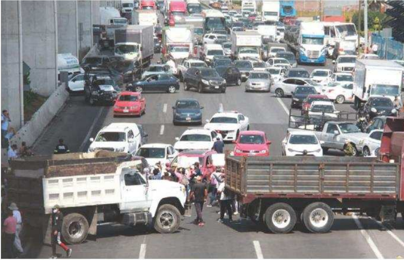
La Guardia Nacional, personal del GEM y del IEEM dialogaron con ellos. IVÁN CARMONA

Suceso. Según inconformes, la diferencia entre candidatos a la alcaldía es muy estrecha; piden una "votación extraordinaria"