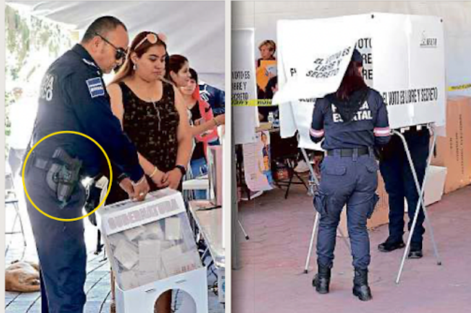
■ Policías municipales y estatales ingresaron armados a la casilla en Texcoco.

Aspectos de la jornada transcurrida ayer para elegir a quien encabezará la gubernatura del Estado de México: