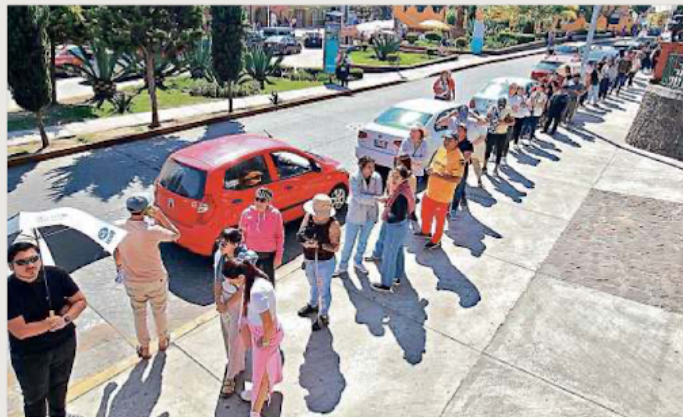
■ En Metepec se formaron largas filas para votar, como en la casilla especial en el centro.