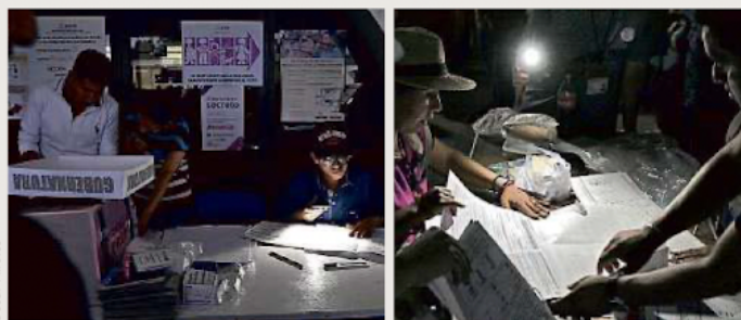
■ A media luz, elaboran y entregan constancias en Atizapán y Nezahualcóyotl.