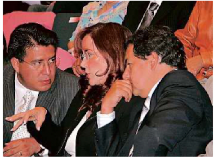
■ La dupla Duarte-Martínez con Yeidckol Polevnsky en 2005, luego de que la perredista perdiera los comicios mexiquenses.

Al renunciar al PRD, recurrieron a Convergencia y PT para mantener la Alcaldía, y decidieron impulsar un perfil ciudadano: Delfina Gómez.