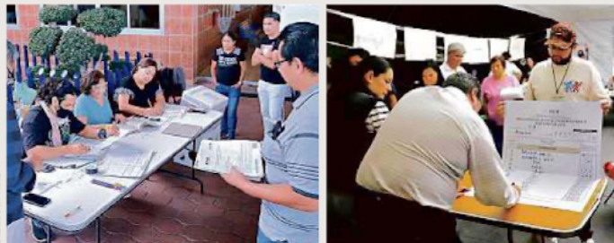
■ Cierre de casillas e inicio del conteo en el Colegio Vallarta, del municipio de Naucalpan, y en el Lomas Country Club, de Huixquilucan.