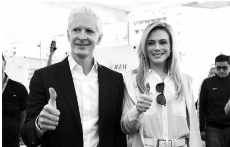
El gobernador del Estado de México, Alfredo del Mazo Maza, saliendo a votar.

Asimismo, resaltó la importancia de la jornada del 4 de junio por ser la entidad mexiquense la más grande del país con casi 18 millones de habitantes y más de 12.6 millones de electores.