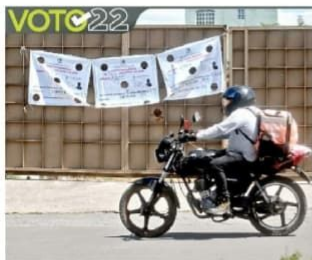
Los lugares donde los hidalgueses emitirán sus votos están listos y en las fachadas lucen las lonas del INE.