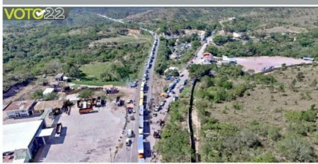
En reclamo por un adeudo de participaciones municipales, habitantes de San Juan Mazatlán Mixe mantenían ayer un bloqueo en Matías Romero, sobre la carretera que va a Veracruz.

Bloqueos y protestas impiden instalación de casillas