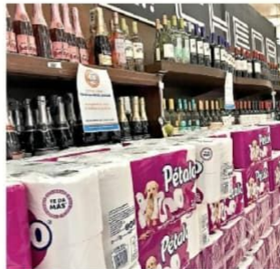
LEY SECA. Comercios y tiendas de Oaxaca suspendieron la venta de bebidas alcohólicas; para tapar las cervezas y otras bebidas, colocaron papel sanitario.

Integrantes del Consejo General del Instituto Estatal Electoral y de Participación Ciudadana de Oaxaca (IEEPCO) sostuvieron ayer una reunión con visitantes extranjeros, quienes realizarán tareas de observación electoral durante la jornada de hoy, Staff