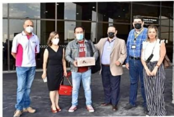
Las autoridades electorales de Tamaulipas resguardaron el paquete que contiene los sufragios del exterior.

“Al concluir el periodo del 10 de marzo se registraron (en el distrito 02) dos mil 481 solicitudes, los cuales podrán