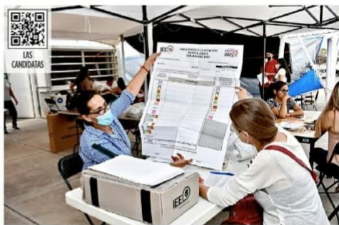
El viernes concluyó el entrega de paquetes electorales a las presidencias de mesas directivas de casilla en Aguascalientes, donde se disputará la gubernatura del estado.

También estarán en los recorridos las senadoras Kenia López y Alejandra Noemí Reynoso.