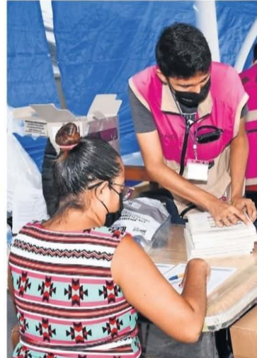
Funcionarios de casilla del INE se alistan para la jornada electoral de este domingo, en la que están en juego seis gubernaturas.