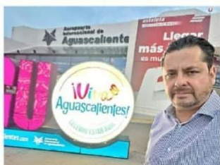
El diputado panista Guillermo Huerta llegó la tarde de ayer al estado para reportar incidentes en las secciones electorales.