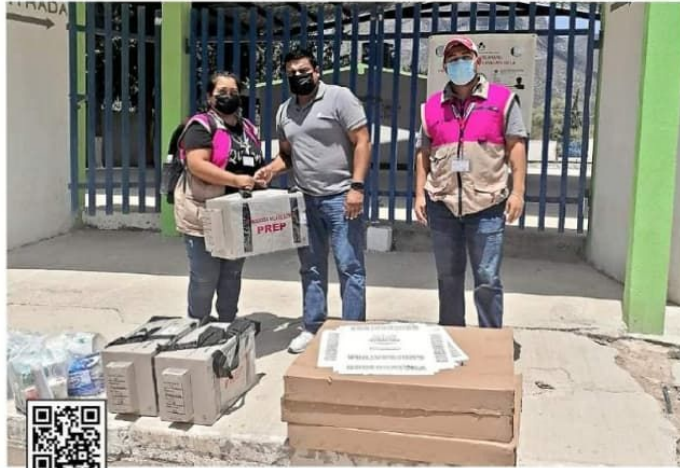
Los tamaulipecos están convocados a las urnas para elegir al sucesor del Gobernador panista Francisco García Cabeza de Vaca.