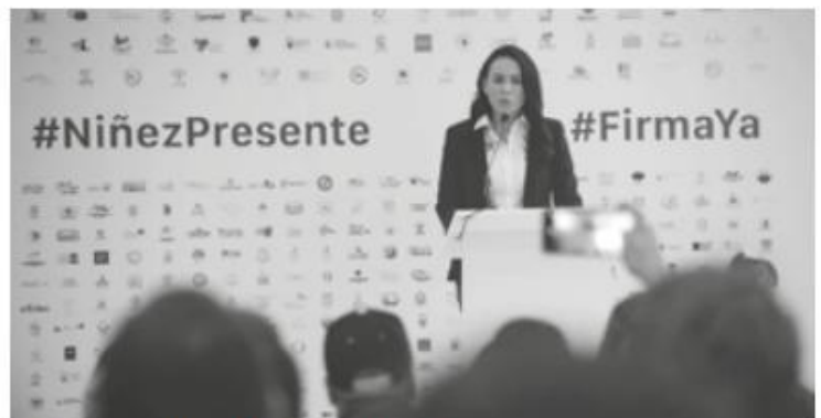
Firma del Pacto por la Primera Infancia.

Prometió crear el Seguro Popular Mexiquense, además de recuperar