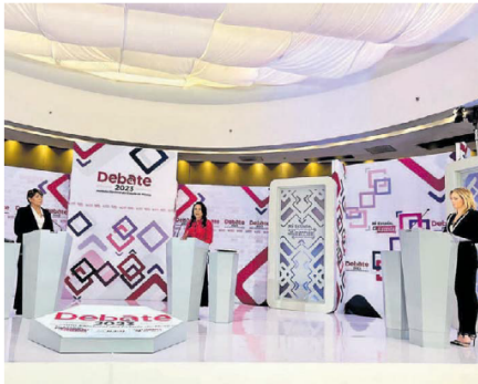
Ambas candidatas asistirán a debate

La representación del partido de Morena ante el IEEM solicitó que se cambiara la moderadora del segundo debate