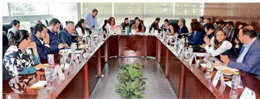
El Comité Especial para la Organización de Debates en Edomex se reúne hoy para discutir nuevas propuestas en logística.

“También el manejo de los que asisten, de los dos lados, tiene que haber esa moderación, sí el aplauso y eso, pero ya la falta de respeto, de que: ‘mírenla, tiene miedo’, esas cosas no quedan en gente que se supone que es-