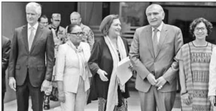
▲ El gobernador mexiquense, Alfredo del Mazo; la secretaria de Seguridad Pública, Rosa Icela Rodríguez; la presidenta del INE,