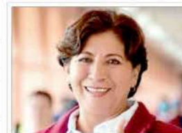
Diversos indicadores apuntan a una victoria de la morenista Delfina Gómez