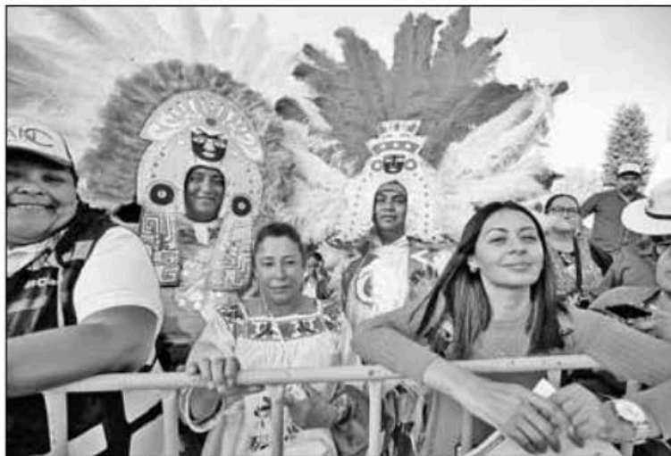
▲ Seguidores de Claudia Sheinbaum, candidata a la Presidencia por la coalición Sigamos Haciendo Historia, se congregaron