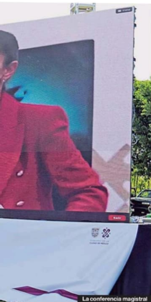
La conferencia magistral