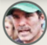
Eduardo Verástegui 139,162 (14.4%)