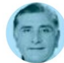
ADÁN AUGUSTO LÓPEZ

► Afinan los preparativos para la XXXIV Reunión de Embajadores y Cónsules, del 9 al 15 de enero. Los primeros días se realizarán encuentros regionales entre diplomáticos, pues el canciller Marcelo Ebrard estará atendiendo la Cumbre de Líderes de América del Norte. Se incorporará para el cierre en el que, además, estará el presidente López Obrador .