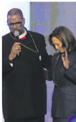
Mensaje. La vicepresidenta Kamala Harris, ayer.