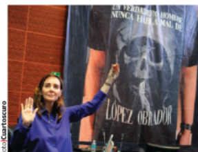
LA LEGISLADORA del PAN, Lilly Téllez, el pasado 25 de abril en el Senado.

"Agradezco, y mucho, a los cerca de 300 mil sonorense que con su voto me otorgaron su confianza para llegar al Senado de la República en una campaña todo terreno... Independientemente del resultado electoral en el Poder Ejecutivo, en el Congreso, en particular el Senado, deberá