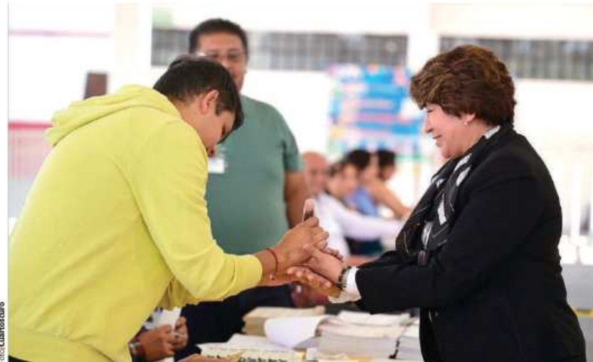
LA GOBERNADORA, Delfina Gómez, al votar el 2 de junio.

Municipios ganó Morena por sí solo en el Edomex