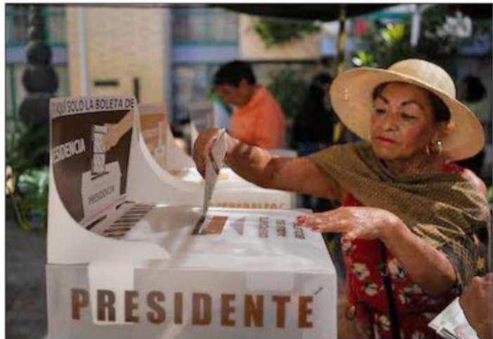
▲ La participación de la ciudadanía fue esencial en los comicios del domingo.

De los triunfos más emblemáticos, Morena se quedó con Ecatepec, con Azucena Cisneros Coss, quien recibió 273 mil 472 votos equivalente a un 43.46 por ciento; arrebató al PRI Toluca con Ricardo Moreno Bastida, que obtuvo 202 mil 675 sufragios, igual a 49 por ciento.