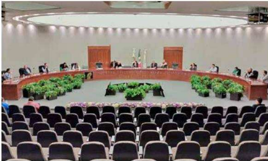
Avanza cómputo de casillas electorales.

De la misma forma, Cuautitlán Izcalli, Cuautitlán, Nicolás Romero, Tultitlán, Texcoco, Te-