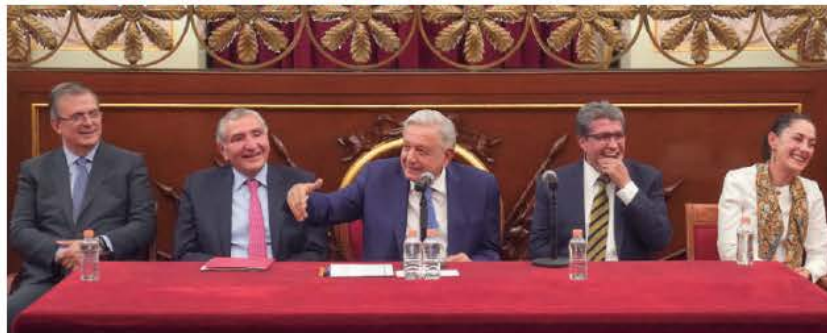
DE IZQ. A DER.: Marcelo Ebrard, Adán Augusto López, Andrés Manuel López Obrador, Ricardo Monreal y Claudia Sheinbaum, el pasado 28 de abril en Palacio Nacional.

nacional de Morena tenía contemplado aplicar la primera encuesta entre agosto y septiembre, y la segunda en noviembre.