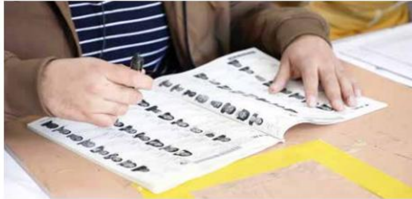
Las listas nominales del EdoMéx son de alta seguridad.

El código tiene la particularidad de que sólo puede ser verificado mediante el uso de una mica especial que únicamente