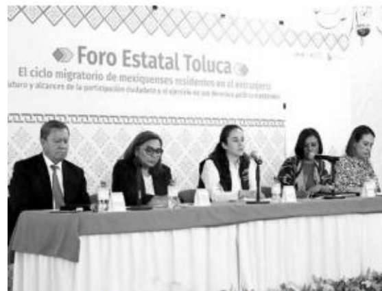
El Foro: Ciclo migratorio de mexiquenses residentes en el extranjero finalizó después de visitar cinco sedes en la entidad.

Destacó que el Voto desde el Extranjero es un ejemplo de ejercer sus derechos político electorales fuera del país, pues se contará con tres modalidades: Postal, Electrónica y Presencial en las sedes consulares de Los Ángeles, California; Chicago, Illinois y Dallas, Texas; para alcanzar esta meta histórica, afirmó, implicó un esfuerzo coordinado entre el IEEM y el INE.