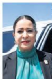
JORGE ALVARADO, EL UNIVERSAL

:::: La falta de uniformidad en los trámites municipales ha sido un obstáculo constante para la inversión y el crecimiento empresarial en el Estado de México.