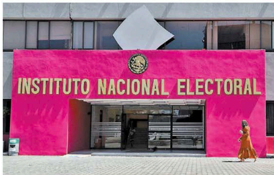
Es explicable la atención en el objetivo electoral.