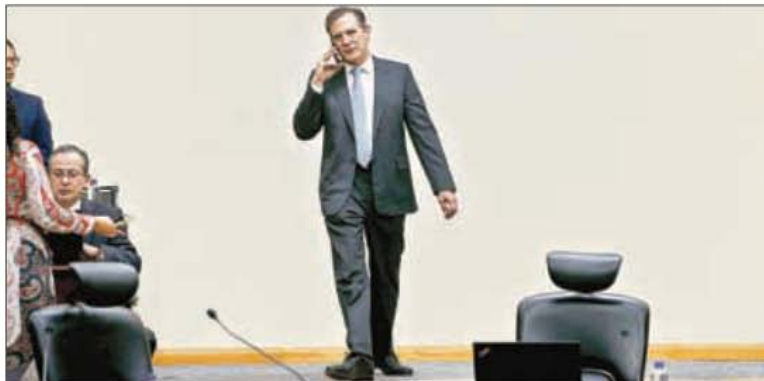
▲ Lorenzo Córdova, aún consejero presidente del INE.

Twitter: @cafevega cfvmexico_sa@hotmail.com