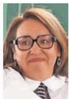
Azucena Cisneros Coss

El gobierno de Ecatepec ha dado un paso significativo al presentar el primer gabinete especializado en combatir la violencia de género y coordinar la búsqueda de personas desaparecidas, un esfuerzo sin precedentes en el ámbito municipal del país. Bajo el liderazgo de la alcaldesa Azucena Cisneros Coss , este gabinete busca responder a la alarmante situación que enfrenta el municipio, que cuenta con dos alertas de género: una por feminicidios y otra por desaparición de mujeres. La iniciativa es un reconocimiento explícito de la gravedad del problema y una oportunidad para implementar soluciones integrales que protejan a las mujeres y garanticen su seguridad. Es fundamental que su implementación esté respaldada por capacitación adecuada, recursos suficientes y una respuesta efectiva de las autoridades. El éxito de este gabinete dependerá no solo de la innovación, sino también del compromiso real para atender las causas estructurales.