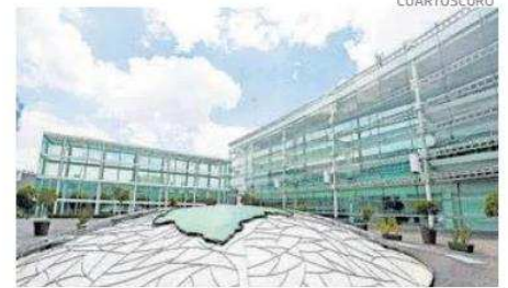
Este jueves inicia la captación de apoyos