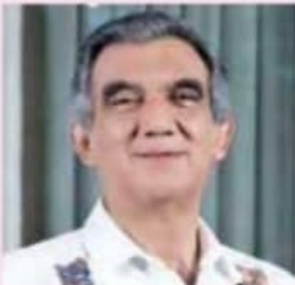
Américo Villareal Anaya Juntos Hacemos Historia (Morena-PVEM-PT)