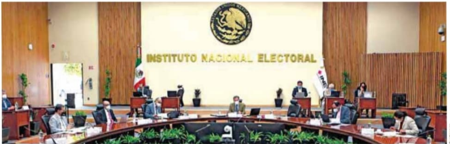
Eliminemos actividades no esenciales.

No se trata de acabar con el INE, sino de hacerlo más barato y mejor. Tener un árbitro electoral independiente es indispensable. El fraude electoral de 1988 es ejemplo de lo que puede ocurrir cuando el árbitro electoral depende del gobierno.