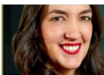
LINOTIPIA PENILEY RAMÍREZ @penileyramirez

Políticas públicas en Estados Unidos han contribuido a la muerte de más de 8 mil migrantes en la frontera. ¿Quién le pide cuentas a esa nación?