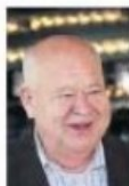
Victor Castro Cosío

:::: Desde Baja California Sur nos comentan que varios habitantes se preguntan para cuándo el gobernador Victor Castro Cosío (Morena), su gabinete y los representantes del gobierno federal se van a reactivar, pues andan en "la cruda" por la