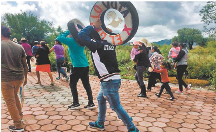
El reto es que se deben potenciar las libertades políticas.