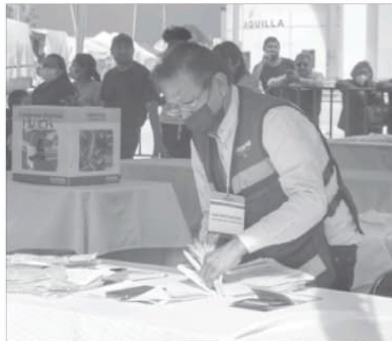
▲ El proceso de selección de consejeros tuvo distintas irregularidades que retrasaron su validación.

Después de un mes de retrasos, este fin de semana el partido guinda tendrá presidencia que los represente en la entidad