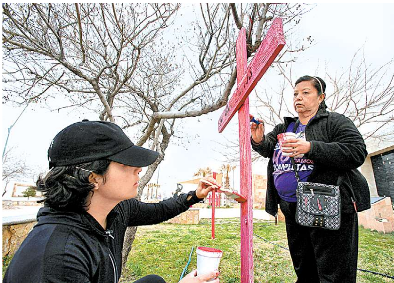
Activistas y madres de víctimas pintan cruces en Chihuahua.