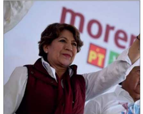
▲ Delfina Gómez Álvarez tomará protesta como Gobernadora Constitucional el 15 de septiembre. Foto especial

EN POCO MENOS de mes y medio, la dinámica política del Estado de México se transformará significativamente. Este cambio, marcado por la llegada de una nueva gobernadora, simboliza un paso adelante hacia una renovación política en el estado. La esperanza recae en que esta transición se traduzca en un gobierno más comprometido, transparente y al servicio del pueblo.