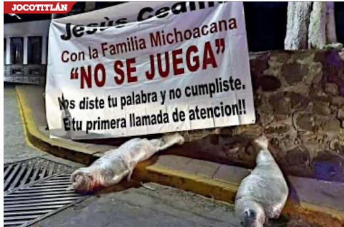
En el municipio mexiquense, el narco dejó una amenaza para el Alcalde y dos cadáveres.