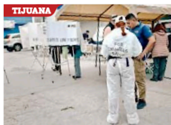
El ataque a balazos a un hombre que estaba formado para votar dejó dos heridos.