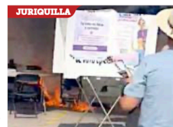
Una bomba casera fue lanzada a una casilla y después el incendio fue controlado.