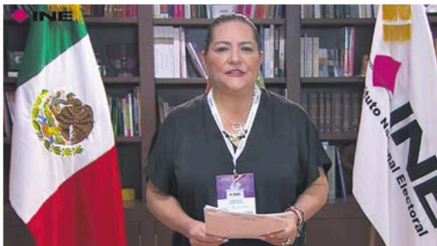
ÁRBITRO. Guadalupe Taddei, presidenta del INE, ayer, al emitir el mensaje con los resultados.

Estos resultados son preliminares y están sujetos a la confirmación de los cómputos distritales, que comenzarán el 5 de junio”