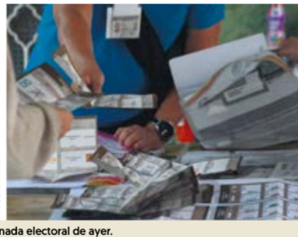
ACTIVOS. Los ciudadanos fueron los protagonistas de la jornada electoral de ayer.

Sheinbaum logró una votación de entre 58.3 y 60.7 por ciento; Xóchitl Gálvez, candidata de PAN, PRI y PRD, de entre 26.6 y 28.6% por ciento, y Jorge Álvarez Máynez, aspirante de Movimiento Ciudadano, de entre 9.9% y 10.8% ciento.