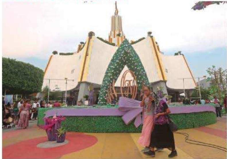
LA IGLESIA Luz del Mundo tiene 5 millones de fieles en 58 países; 1.5 millones están en México.

cargos, aunque en un principio el total de delitos en su contra eran 36.