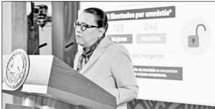
▲ La secretaria de Seguridad, Rosa Icela Rodríguez, explicó que, por protocolo, la