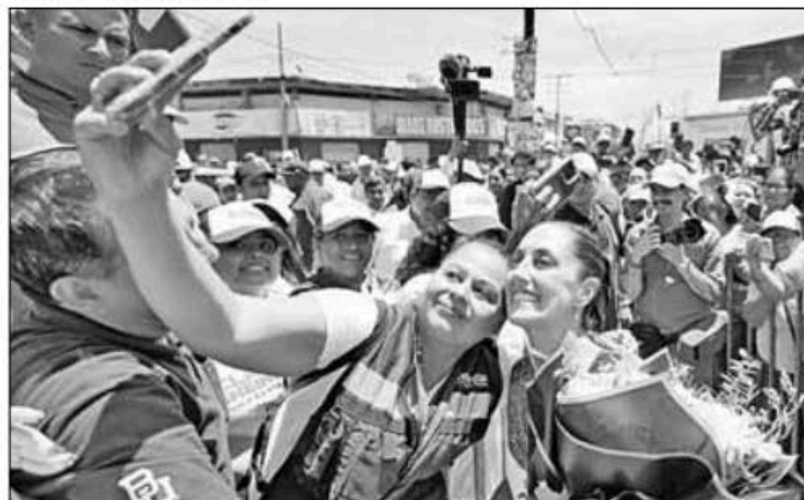
▲ Claudia Sheinbaum afirmó que con su guerra sucia, la oposición lo que ha logrado es