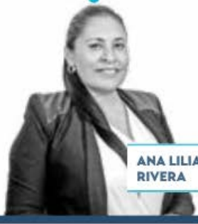
ANA LILIA RIVERA

► Medida drástica implementó la presidenta de la Mesa Directiva del Senado, Ana Lilia Rivera Rivera , para evitar que los legisladores rebasen el tiempo de participación en tribuna: se le apaga el micrófono en el momento en que se extienden más allá de lo marcado en el reglamento. En la sesión de ayer se la aplicaron a cuatro: las panistas Josefina Vázquez Mota y Lilly Téllez ; a la emecista, Patricia Mercado ; y al morenista César Cravioto .