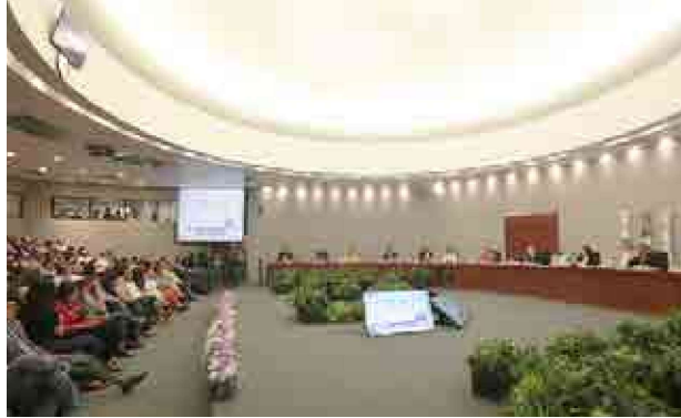
Amalia Pulido, presidenta consejera del Instituto Electoral del Estado de México (IEEM), habló de los pormenores de la elección

"Estaremos sesionando en los próximos días para determinar estos requerimientos con exactitud. Estamos esperando el informe de la Dirección de Partidos Políticos, y una vez que lo tengamos, el Consejo General tomará una decisión sobre el asunto. La