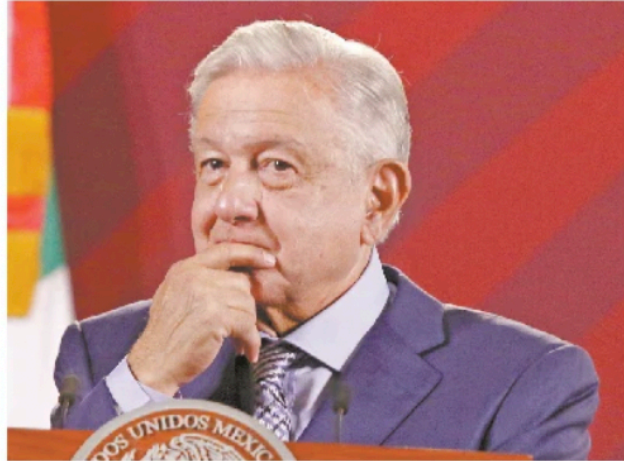
El presidente Andrés Manuel López señaló que Edmundo Jacobo ganaba más de 166 mil pesos al mes.

"No, pues es muy probable que el Poder Judicial anule la ley electoral y él regrese a su cargo y pueda tardar otros 15 años. Porfirio tardó 30, más