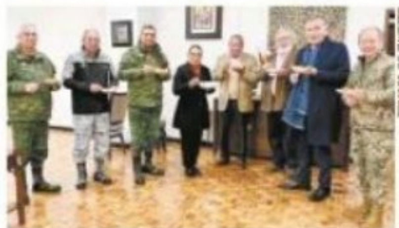
La tamaliza en el Gabinete de Seguridad

Las reuniones tempraneras del Gabinete de Seguridad que tanto presume el presidente López Obrador como instrumento para disminuir la violencia en el país no sólo se tratan de cifras de muerte y reportes de muchos más balazos que abrazos. Nos cuentan que también hay espacio en ellas para celebren algunas tradiciones, como la del Día de la Candelaria. Rosa Icela Rodríguez , secretaria de Seguridad, publicó la foto de los participantes de ayer, comiendo los tamales de rigor, que esta vez los puso el secretario de la Defensa, el general Luis Crescencio Sandoval , quien aparece en la imagen con el secretario de Gobernación, Adán Augusto López ; el subsecretario Alejandro Encinas , y los hombres de armas el almirante Rafael Ojeda , secretario de Marina; el general David Córdova , comandante de la Guardia Nacional; el general Ricardo Trevilla , jefe del Estado mayor de Sedena, y el general Audomaro Martínez , director del Centro Nacional de Inteligencia. Nos cuentan que, si bien los tamales eran de chípílin, cuando se preguntó de qué había, no faltó quien dijera: ¡Puros verdes!