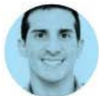
INCONFORMES CON ROMMEL

► Encarrerada va la gobernadora del Edomex, Delfina Gómez , en su plan para reducir la delincuencia. Luego de que en sus primeros 100 días de gobierno los delitos disminuyeron 7.2%, la mandataria celebró ayer su primera reunión del año con su gabinete de seguridad, y se comprometió a ampliar ese porcentaje en los 125 municipios.