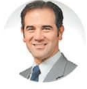
Lorenzo Córdova Consejero presidente del INE

“La independencia del PJF será importantísima para el orden constitucional y el futuro de la democracia”