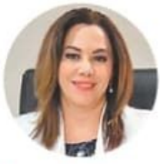
Blanca Lilia Ibarra Comisionada presidenta del INAI

“La independencia del PJF será importantísima para el orden constitucional y el futuro de la democracia”