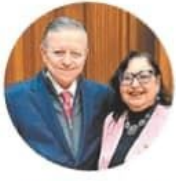
Arturo Zaldívar Ministro de la SCJN

“Celebro que una mujer de destacada carrera judicial y reconocido prestigio encabece el tribunal”