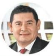
Alejandro Armenta Presidente del Senado

“Confío en que la nueva presidencia de la Corte devolverá a esta institución la imparcialidad”