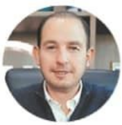
Marko Cortés Presidente del PAN

“Es un día histórico para nuestro país. Por primera vez una mujer ocupa la presidencia de la SCJN”