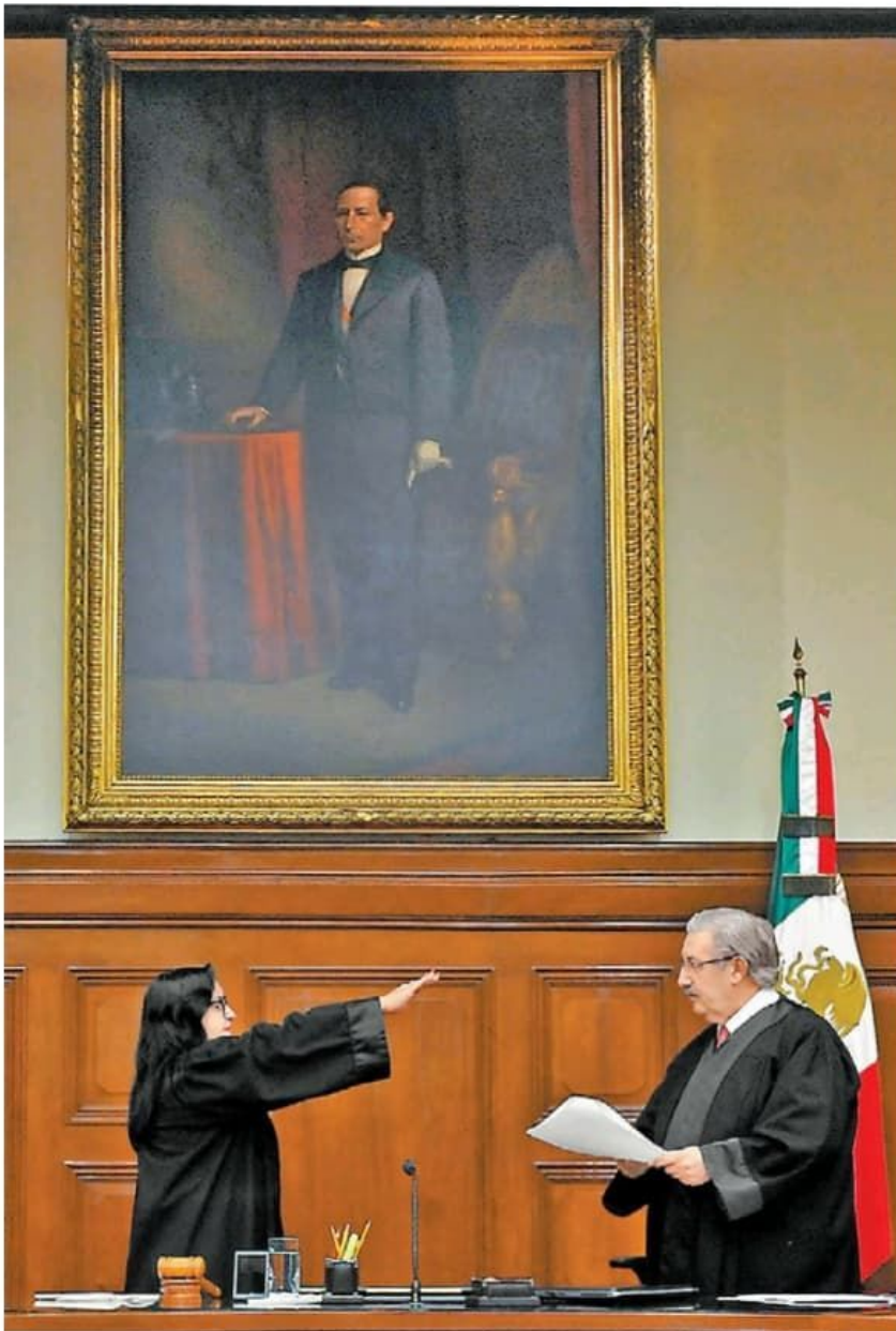
Tras rendir protesta, dijo que ahora también representa a las mujeres.

Relevo. Se convierte en la primera ministra en encabezar el máximo tribunal tras recibir 6 votos, uno más que Gutiérrez Ortiz Mena; INE e INAI aplauden resultado