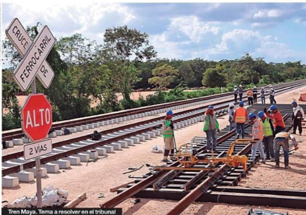
Tren Maya. Tema a resolver en el tribunal