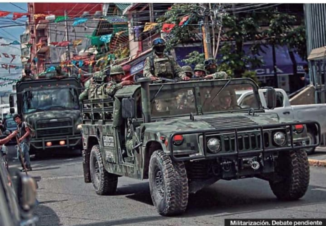
Militarización. Debate pendiente

Lo anterior impedirá a la Corte pronunciarse sobre el tema antes de marzo de este año y causará que el periodo electoral que iniciará en septiembre se realice bajo las nuevas reglas de la reforma impulsada por López Obrador. ●