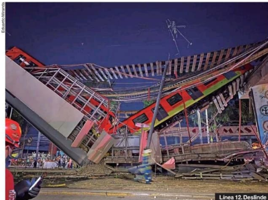
Línea 12. Deslinde

—Tendríamos que valorarlo, pero yo diría que sería muy inusual que yo me separe del cargo y los demás no. Les doy otra ventaja; ¿no? ●