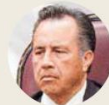
● Cuitláhuac García

vale es ganar elecciones, agachar la cabeza ante Palacio Nacional y cerrar la boca. Y repetir que se ha sacado a millones de la pobreza, vencido a los corruptos y participado con vigor en la transformación de México. Así sobreviven Rocha y Américo y Monreal , el gobernador. Así sobrevivieron Cuauhtémoc y Rutilio , y así son alabados Evelyn y May . Caquistocracia es el concepto con que la sociología política categoriza a los gobiernos de los peores y donde la ineptitud es gratificada. Suerte a Cuitláhuac , pues, en su cargo importante y estratégico. Sabe bien lo que debe hacer.