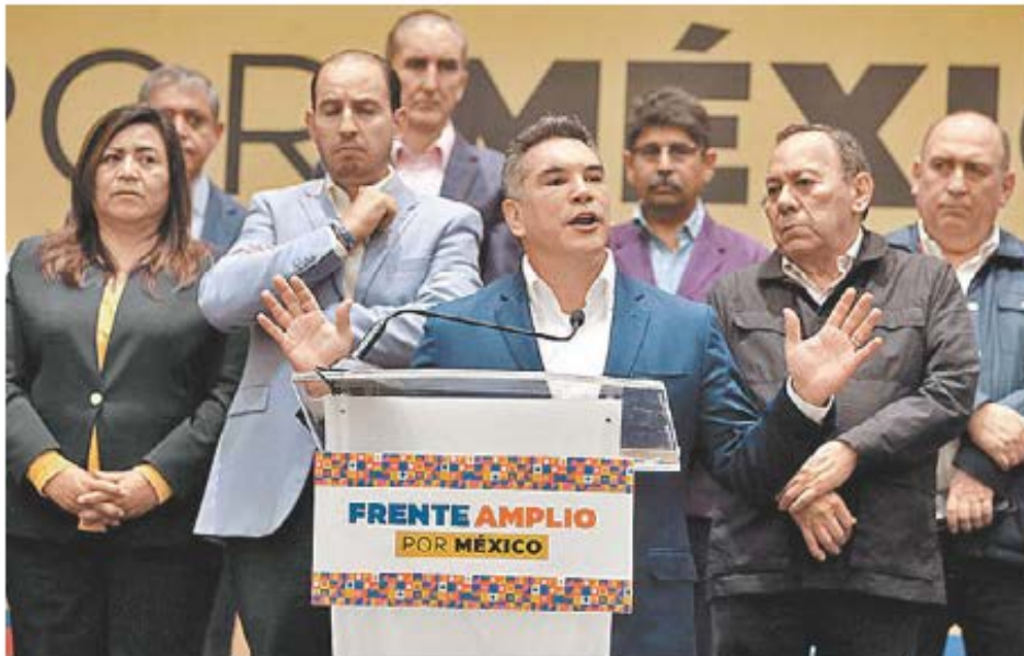
El Frente deberá reencontrar las razones de su existencia. JAVIER RÍOS