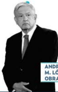
ANDRÉS M. LÓPEZ OBRADOR

► Dos anuncios importantes para la infraestructura del país hizo ayer el presidente López Obrador , al rendir su Quinto Informe de Gobierno, en Campeche. Uno es la inauguración del Tren Maya, en diciembre próximo, con lo que planea detonar los ingresos turísticos en el sureste. El otro es la reanudación de operaciones de la aerolínea Mexicana, en noviembre, pero ahora operada por la Secretaría de la Defensa, a cargo de Luis Crescencio Sandoval .