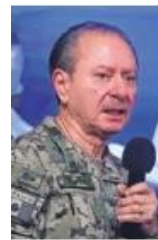
José Rafael Ojeda Durán

:::: Nos cuentan que en la Secretaría de Marina, que comanda el almirante José Rafael Ojeda Durán ,