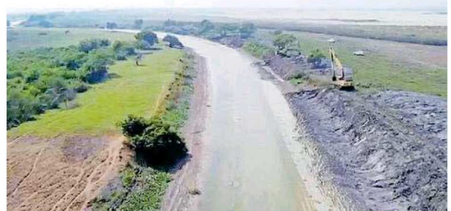
Enviarán agua del río Mante para mitigar la falta de líquido