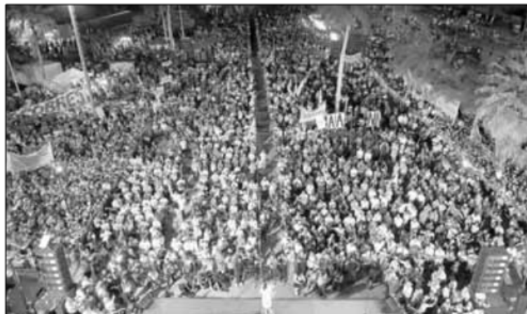
▲ La candidata presidencial de la coalición Sigamos Haciendo Historia, Claudia Shein-