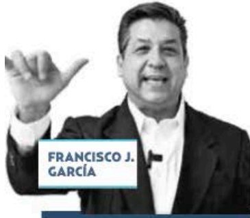
FRANCISCO J. GARCÍA

► Nocaut propinó el INE, presidido por Guadalupe Taddei , al exgobernador de Tamaulipas, Francisco Javier García Cabeza de Vaca . El organismo electoral ratificó la sentencia del Tribunal Electoral, que rechazó su candidatura a diputado federal plurinominal del PAN, porque hay dos órdenes de aprehensión en su contra. Fueron 10 de los 11 consejeros electorales los que avalaron impedirle ser candidato, por lo que el panista posiblemente pasará seis años más viviendo en el extranjero.