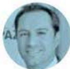
MAURICIO VILA DOSAL

► Es un hecho que el presidente López Obrador cerrará su sexenio, el último día de septiembre próximo, sin que su administración reciba remanentes. Y es que el Banxico, a cargo de Victoria Rodríguez Ceja , reportó pérdidas por $440 mil millones en 2023, debido a los efectos del superpeso. La cifra es la más alta en los últimos 24 años.