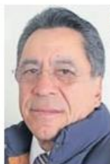
Ignacio Salgado García.

:::: El creciente gasto en pensiones dentro del ISSEMyM pone en evidencia un problema estructural que podría comprometer la viabilidad financiera del instituto a largo plazo. Con más de la mitad del presupuesto destinado a estos pagos y sólo un 11% para la nómina administrativa, queda claro que los recursos para mejorar los servicios de salud y atender a los derechohabientes son cada vez más limitados. Si bien garantizar el bienestar de los pensionados es una prioridad, es urgente que las autoridades exploren alternativas para fortalecer las finanzas del instituto sin descuidar la calidad en la atención médica. El director del ISSEMyM, Ignacio Salgado García , enfrenta el reto de equilibrar las finanzas del organismo sin afectar a sus beneficiarios. La actual distribución del presupuesto sugiere la necesidad de reformas que permitan garantizar la sostenibilidad del sistema de pensiones sin sacrificar la inversión en infraestructura hospitalaria, medicamentos y personal médico. Y las protestas ya existen.