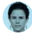
LUISA MARÍA ALCALDE