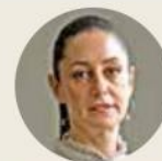
● Claudia Sheinbaum

no quiere ir a una confrontación con Estados Unidos, pero adelantó que, en respuesta, ha ordenado imponer aranceles a los productos y bienes estadounidenses que entren al mercado mexicano. Añadió que el respeto a la soberanía nacional “no es negociable”. Trump escribió que cumplía una promesa de su campaña electoral, ya que México poco había hecho para detener “la avalancha” de migrantes ilegales y el tráfico de drogas. Y como