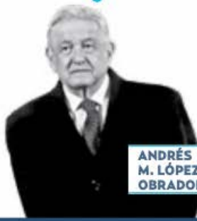
ANDRÉS M. LÓPEZ OBRADOR

› Nos dicen que el presidente electo de Guatemala, Bernardo Arévalo , jura y perjura que su homólogo mexicano, Andrés Manuel López Obrador , asistirá a su rendición de protesta el próximo 14 de enero, en la capital de ese país. Sin embargo, en Palacio Nacional ni confirman ni desmienten la versión, pero comentan que la próxima semana el mandatario dará a conocer si irá o no. De confirmarse, sería el primer viaje del tabasqueño al extranjero este 2024.