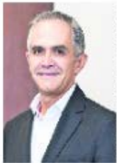
Miguel Ángel Mancera