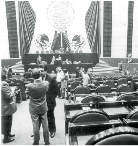
En la década de los 90 fue la última vez que se vio un partido hegemónico en el Congreso.

Protagonista indiscutible de la vida política