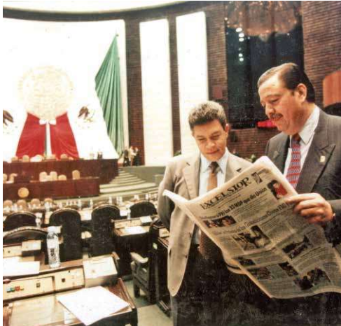
Diputados, en el año 2000, daban cuenta de las transformaciones políticas en el país.

Profuso en el número de propuestas que entregó al Congreso de la Unión, Felipe Calderón usó prácticamente todos los mecanismos legales con el Poder Legislativo en la ríspida