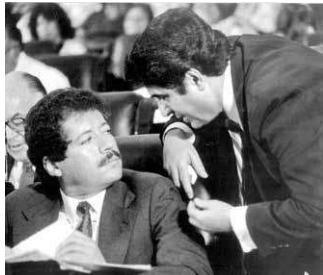
En la década de los 80, Luis Donald Colosio formaba parte de la aplanadora priista en el Congreso de la Unión.

tensión política, porque los legisladores del PRD no aceptaron la derrota presidencial y le cerraron incluso con candados los accesos al salón de plenos de San Lázaro para impedir que rindiera protesta como Presidente de la República, gracias al apoyo del PRI. Ingresó por la zona tras banderas y en medio del caos rindió su protesta de ley.