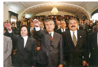
Toma de protesta en el Senado en el año 2000.