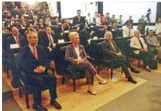
Senadores de la República, en la vieja casona de Xicoténcatl.