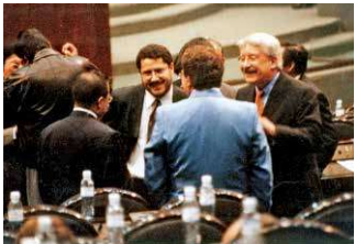
Con el sexenio de Vicente Fox el PRI no tuvo hegemonía.