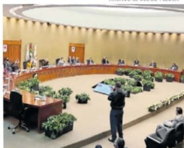
El IEEM exhortó a respetar las normativas.