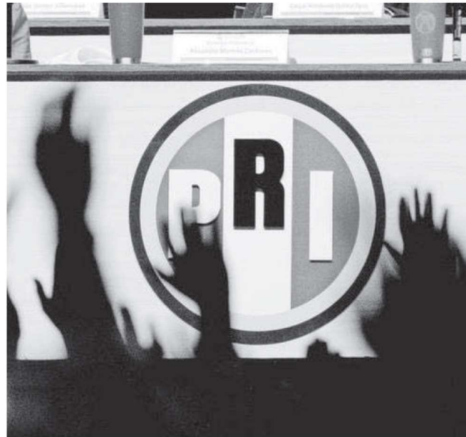
El Tribunal declaró fundados los agravios consistentes en que la autoridad responsable aplicó indebidamente las reglas

Por ello, se asignaron las diputaciones con la votación válida efectiva con los ajustes necesarios para que el PRI y Morena se encontraran en los límites constitucionales de más ocho y menos ocho; por lo que se asignaron seis y siete curules de representación proporcional, respectivamente y los espacios restantes se dividieron entre los partidos políticos restantes y se verificó que ningún partido se encontrara por debajo