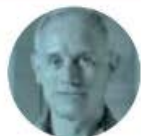
HUGO LÓPEZ- GATTEL

› EU le retiró el Global Entry a los directivos de Seguritech. Podría parecer un caso aislado; pero ambos están ligados a la firma DAI LLC que adquirió la casa donde vive el exgobernador de Guanajuato, Diego Sinhue . Los que saben del tema dicen que es el primer paso para el retiro de visas y las investigaciones por el escándalo de la Casa Azul.