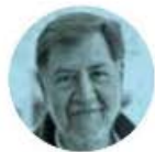
GERARDO FERNÁNDEZ NOROÑA

› Nuevas acciones anunció la Secretaría de Agricultura, que encabeza Julio Berdegú ; a partir del 7 de julio queda prohibido transportar ganado no inspeccionado desde las zonas afectadas a las regiones centro y norte, para prevenir la propagación del gusano barrenador. Está en riesgo no sólo el ganado, sino la economía agrícola y ganadera.