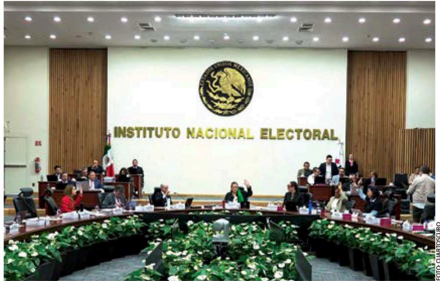
La presidenta Claudia Sheinbaum informó que su gobierno impulsará en el Congreso una Reforma Electoral.

El proyecto de López Obrador, redactado por Pablo Gómez y Horacio Duarte, dos de los grandes consejeros políticos del exmandatario, proponía transformar el INE en el Instituto Nacional de Elecciones y Consultas (INEC), que quedaría como la única autoridad para organizar todos los comicios, tanto federales como estatales, así como las consultas populares y revocatorias de mandato. El expresidente proponía reducir de 11 a siete el número de consejeros electorales, mismos que tendrían que ser electos por voto