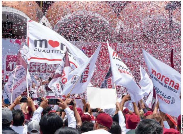
UN EVENTO de Morena, en junio del año pasado.

Para enfrentar este reto, conviene que recordemos lo sucedido durante el periodo histórico conocido como el Maximato. Si se siguiera el modelo que funcionó entre 1929 y 1936, tendríamos un