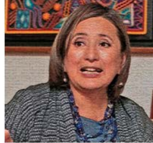
Lilly Téllez y Xóchitl Gálvez, protagonistas de la semana en la oposición.

izquierda democrática e izquierda socialista y MC, donde toda su propuesta camina por el carril izquierdo, tendremos una elección entre izquierdas.