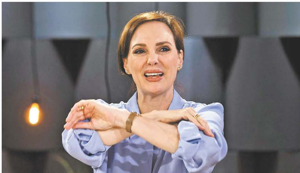
La senadora sonorense anunció el miércoles que no contendría en las internas del Frente Amplio. JORGE GONZÁLEZ

Para ambas, conseguir 150 mil apoyos no habría sido problema; el reto se encontraría en el mecanismo de elección primaria que se ha colocado como última estación del proceso para conseguir la candidatura de la oposición