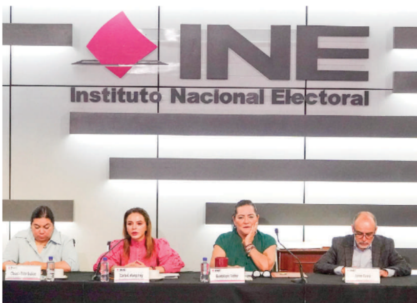
CONSEJEROS del INE en conferencia de prensa, ayer.

LA CONSEJERA presidenta espera que resultado sea "validado y respetado por todos"; está garantizada la objetividad, neutralidad y confiabilidad, señala; seleccionan muestra de 17 mil 592 casillas para realizar los 12 Conteos Rápidos